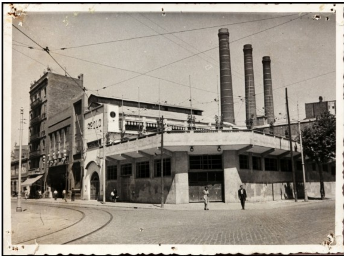
Edifici durant la postguerra

A l'Apolo [3] s'hi podrà repassar tota la història passada i present a través de tres exposicions fotogràfiques que recolliran el testimoni visual de la sala i el seu entorn immediat i sobretot dels grups que han passat a actuar-hi i de les nits més memorables. La quarta exposició serà de cartells on s'ensenyarà el disseny gràfic que ha marcat Barcelona, els corrents estilístics que s'han anat superant i com l'Apolo, com tantes altres empreses, s'ha anat adaptant sense deixar de mantenir la seva estètica.