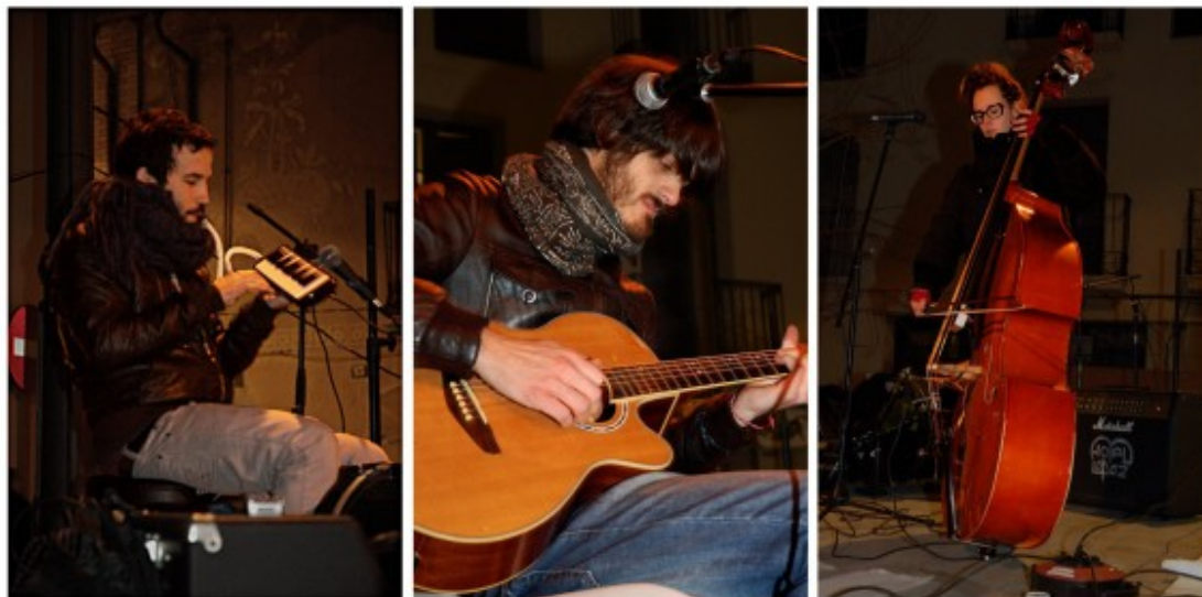
Els Catarres al seu primer concert, a Aiguafreda