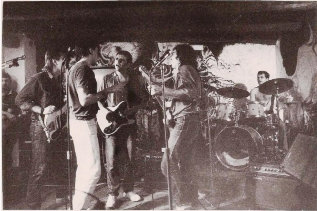
Sopa de Cabra va debutar l'agost de 1986 a la sala Ciam Ajn de L'Estartit

Però va arribar un salvador per fer possible el debut de Sopa de Cabra : "Finalment un amic de la colla, el fotògraf Rafel Bosch, va arribar amb el seu 600 i ens va salvar l'actuació. Mentre esperàvem hores, Francesc 'Cuco' Lisicic (baixista) anava dient: 'Això és pitjor que un mal tripi', amb cara d'això no ens pot estar passant, ho recordo com si fos ara".