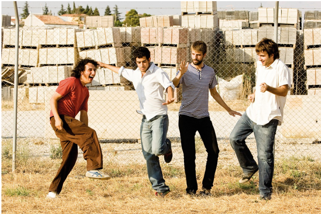
Manel van debutar a Tàrrrega a la preliminar del Sona 9 del 2007

Repassem els debuts en directe de 10 artistes i grups catalans | De Lluís Llach i Maria del Mar Bonet a Txarango i Manel