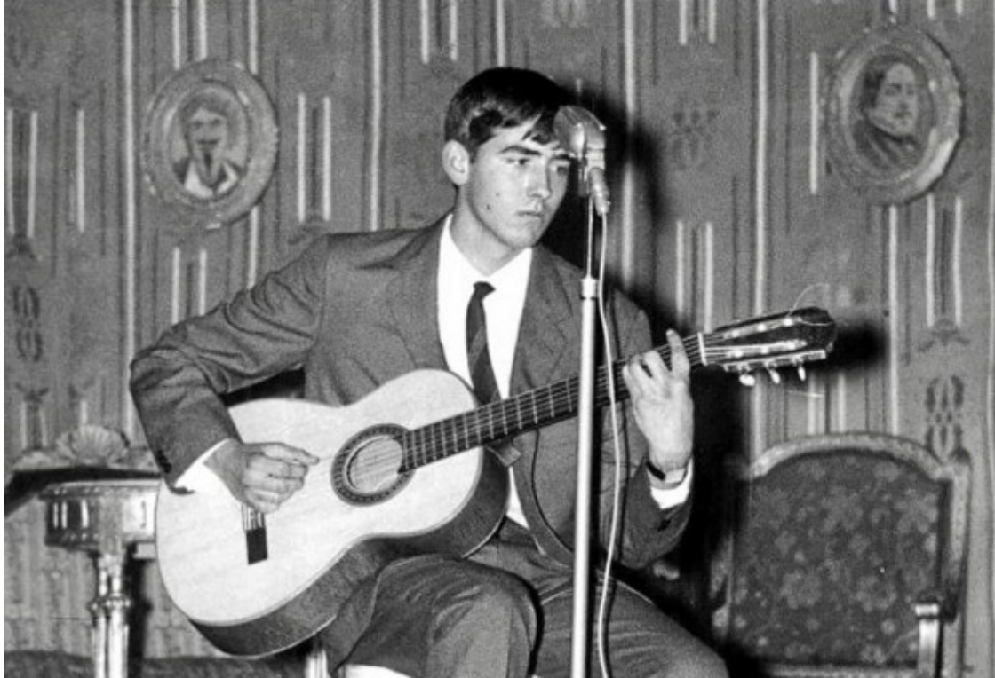
Serrat debut 1965 a Esplugues de Llobregat

menjador de casa per a una reunió d'amics. Semblava poc professional, però tenia el seu encant".