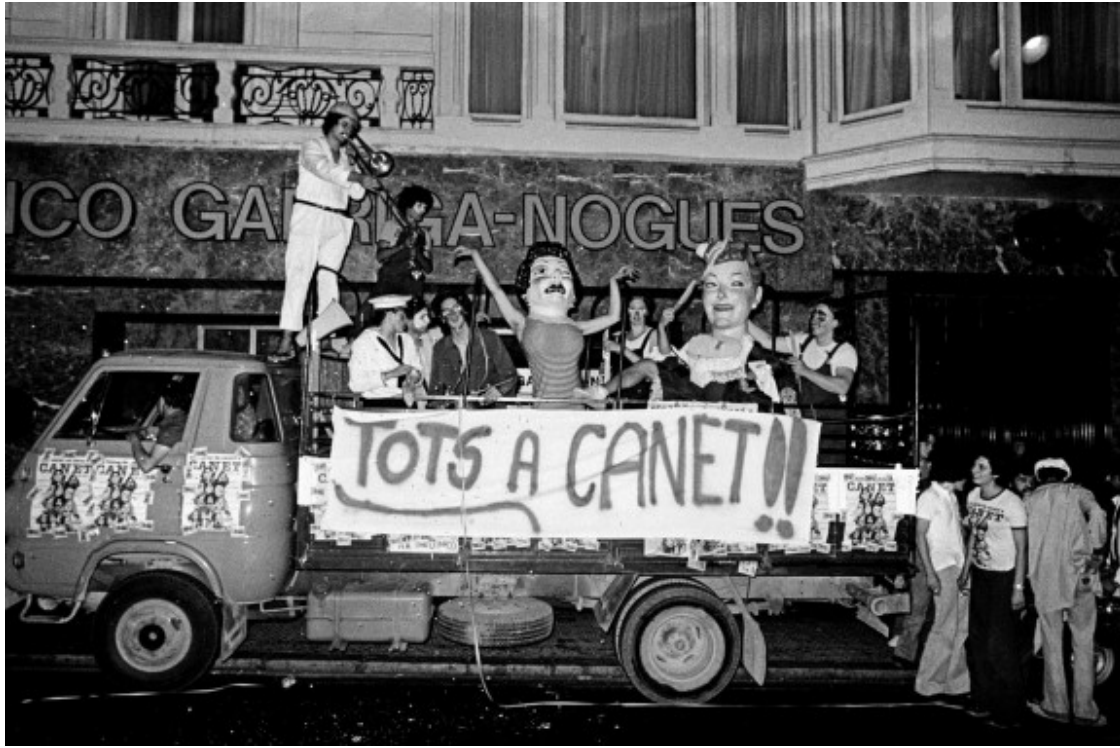
Sis Hores de Cançó a Canet de Mar

dimecres 11 de juliol a les 19.30 h a la llibreria Calders (Passatge de Pere Calders, 9) de Barcelona.