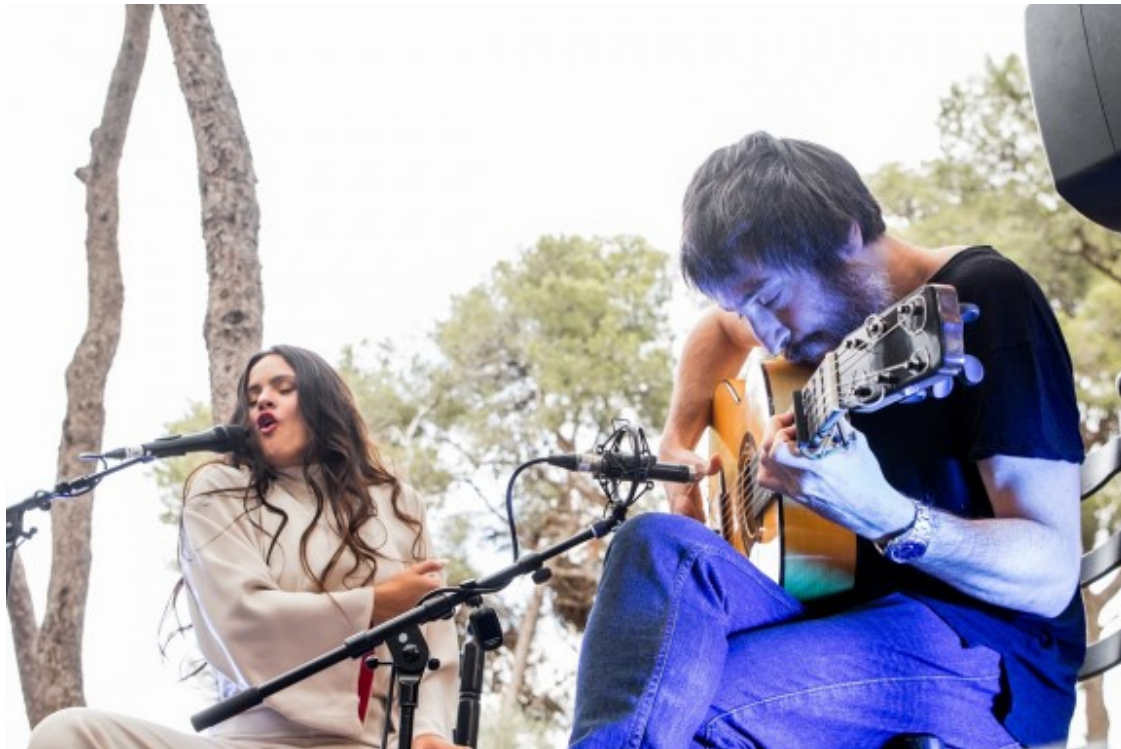
Rosalía i Raül Refree en concert.

Després d'omplir com mai s'havia vist l'escenari de la Barca del Vida Festival ( http://www.enderrock.cat/noticia/15225/vida/10/concerts ) l'estiu del 2017, el duet va tancar la gira del seu exitós EP al Palau de la Música, l'1 de març del 2018. Va ser una de les últimes actuacions de Rosalía en un format acústic abans de començar el seu gran projecte de masses.