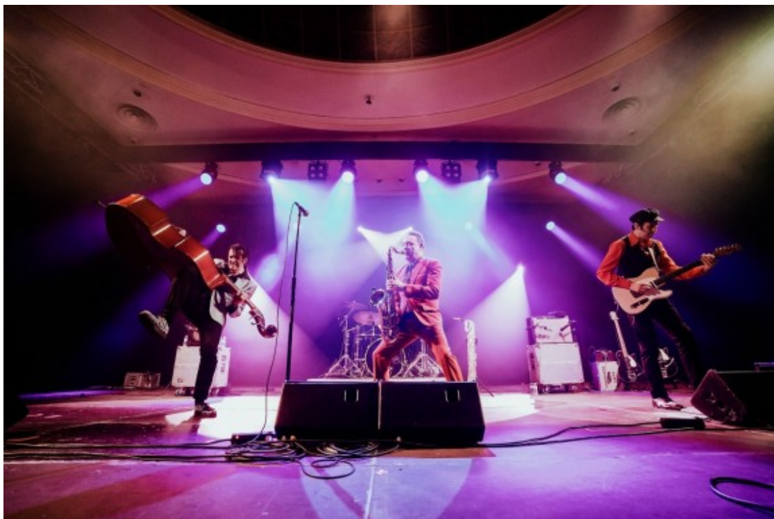
Los Mambo Jambo al Secret Vida.

Els combinats Premium valen 12 euros a unes barres ben ateses i sense cues. Al privatRat, packs de cervesa Damm i vins de can Torres (blanc i negre de Jean Leon). Alguns periodistes es pregunten indignats per què no s'ha filtrat el programa d'actuacions, d'altres estan preocupats perquè han d'entrevistar els caps de cartell que actuaran l'endemà -des del Niño de Elche fins a The Temples - i ningú els ha filtrat qui són. La inquietud per saber qui tocarà se'ls torna a la contra, però per als hipsters és un joc divertit. Aquesta era la gràcia del Secret Vida, almenys a la primera edició.