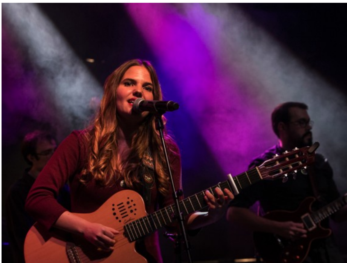
Portada EDR 245

Aquests directes inauguraran la cita figuerenca d'enguany, que s'inicia en dijous, tot i que la festa continuarà a la plaça Catalunya amb Suu , Momo 'Tribut a Queen' i Jazzwoman , i amb una Rambla que explotarà d'energia amb les actuacions de l'indomable raper Lildami i la fusió internacional de La Pegatina , que el mes de setembre publicarà nou àlbum. A més, entre la programació d'aquest 2019 s'hi troben també bandes com Oques Grasses , Zoo , El Pot Petit , El Petit de Cal Eri , Ramon Mirabet i Dorian , entre molts altres. Els mateixos grups expliquen com encaren els concerts a Figueres: