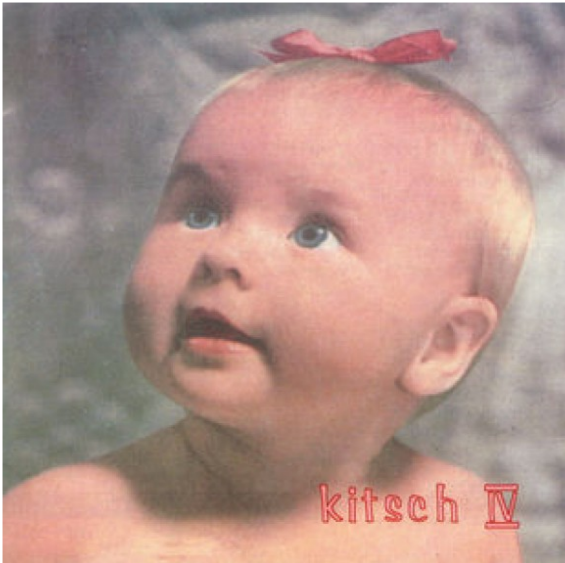
Portada del disc 'IV' de Kitsch