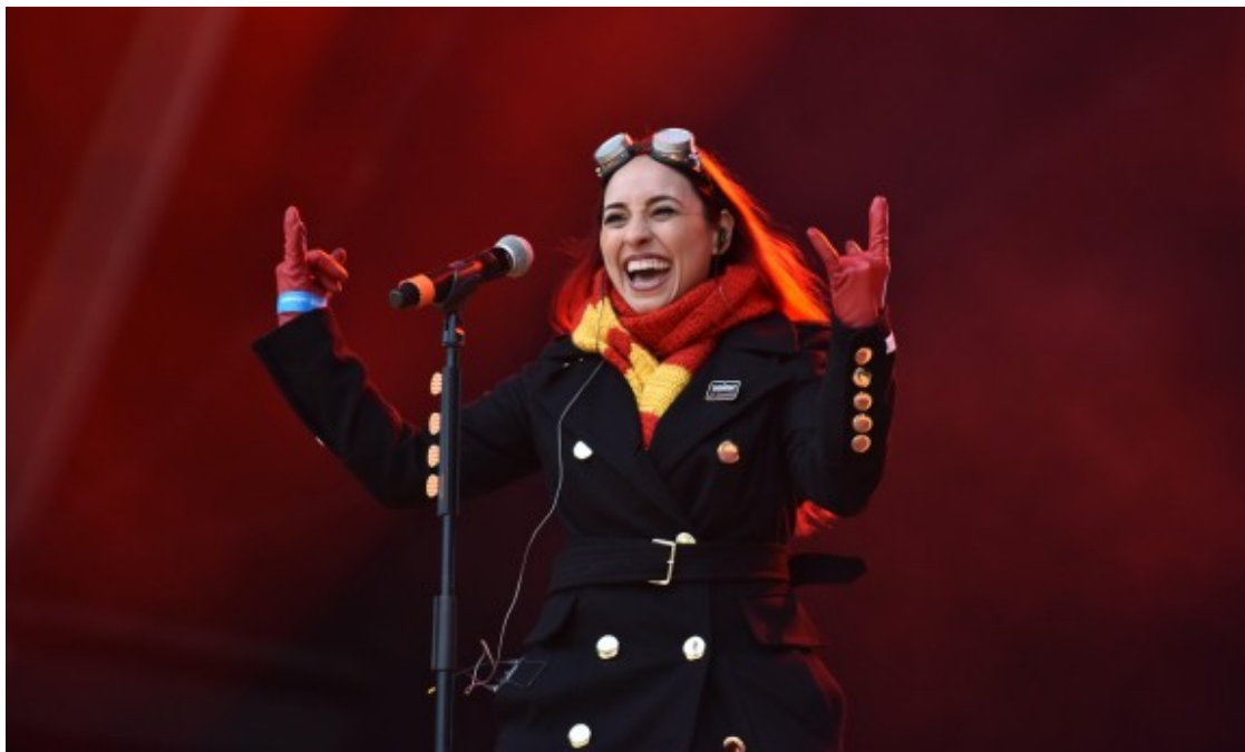
A Sound of Thunder.