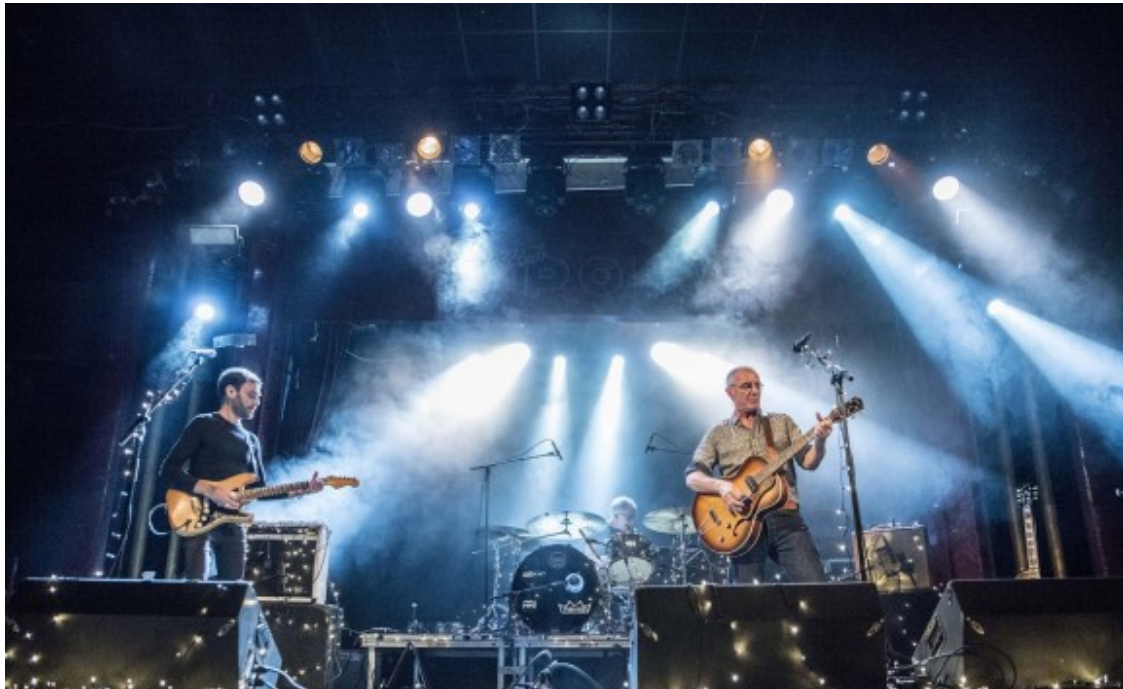
Quimi Portet i la seva banda.

A partir d'aquí, és a dir en menys de mitja hora d'actuació, la temperatura puja amb cançons com "Tinc una bèstia dintre meu" o "Homes i dones del cap dret", sap riure's de la seva pròpia sobrietat i la de tots nosaltres asseguts amb un simple "Sí!" abans d'entrar als solos. Entre el públic hi havia alguns tarambanes com Sisa o Pau Riba , als quals Portet també va dedicar la cançó en la quals els menciona, "Francesc Pujols".