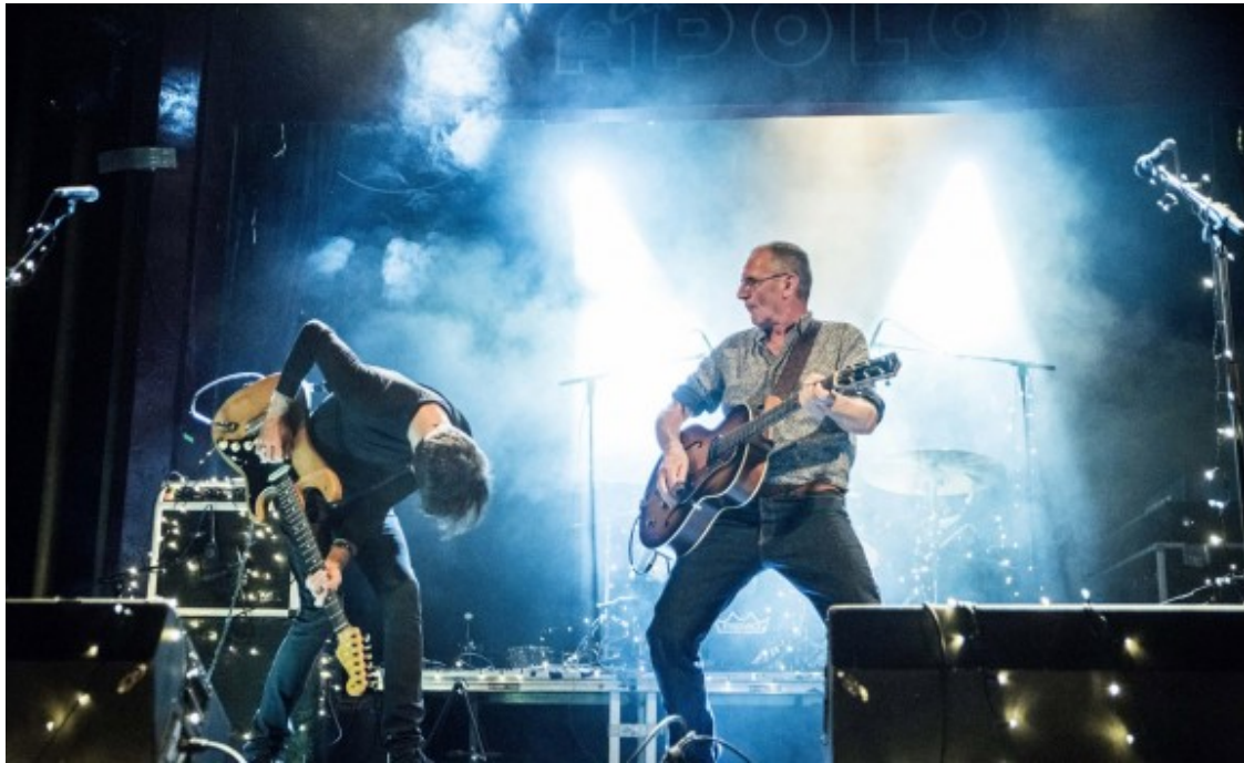
Quimi Portet i la seva banda.