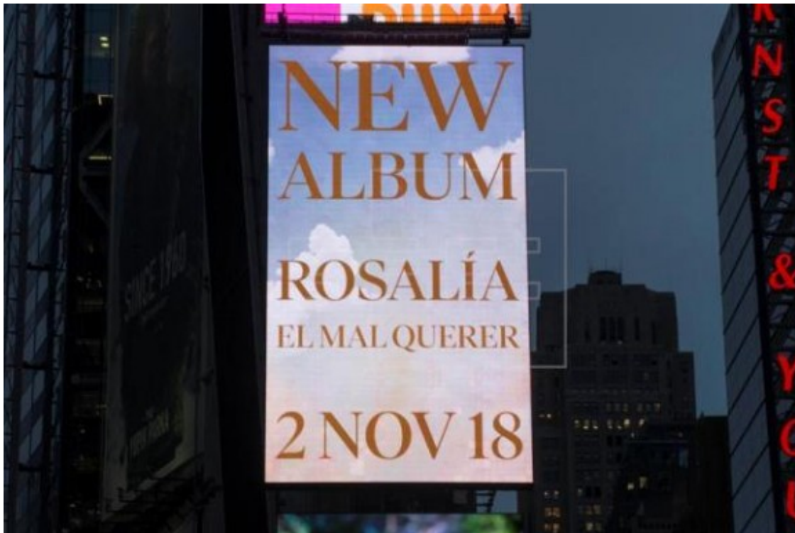
Anunci del nou disc de Rosalía a Times Square.