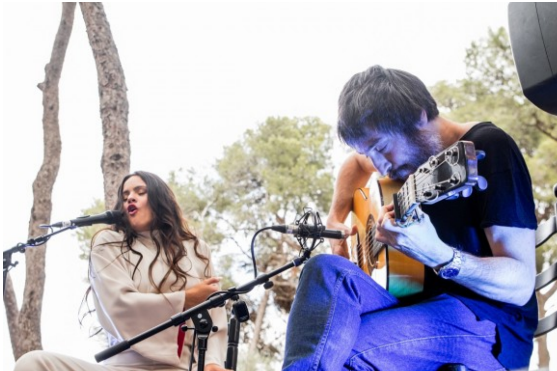
Rosalía i Raül Refree en concert.

Després d'omplir com mai s'havia vist l'escenari de la Barca del Vida Festival l'estiu del 2017, el duet va tancar la gira del seu exitós EP al Palau de la Música, l'1 de març del 2018. Va ser una de les últimes actuacions de Rosalía en un format acústic abans de començar el seu gran projecte de masses.