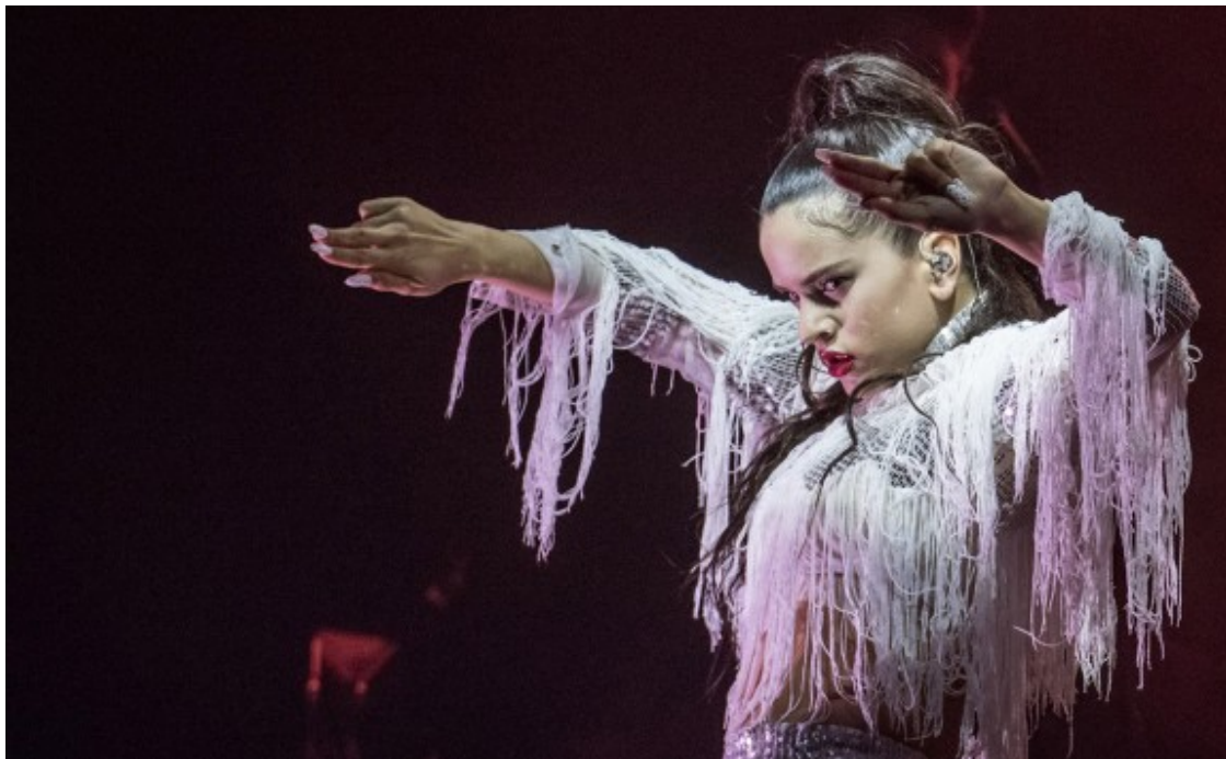
Rosalía al Sónar.

Amb aquesta potent carta de presentació, la cantant debutava al Sónar el 15 de juny amb una actuació que no va decebre la gran expectació que ja havia generat. Rosalía incorporava llums, ballarines i un vestuari ben característic que l'ha portada a ser entrevistada per la revista Vogue .