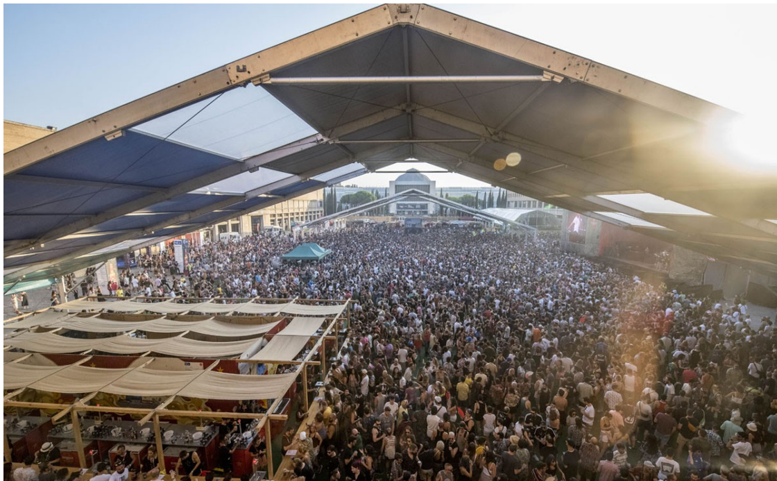
Sónar Festival | Xavier Mercadé

El canvi de data, l'amenaça de vaga dels tramoistes i l'onada de calor van afectar la nebulosa electrònica.