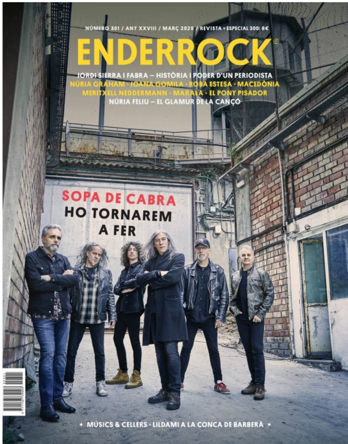
Portada Enderrock 301