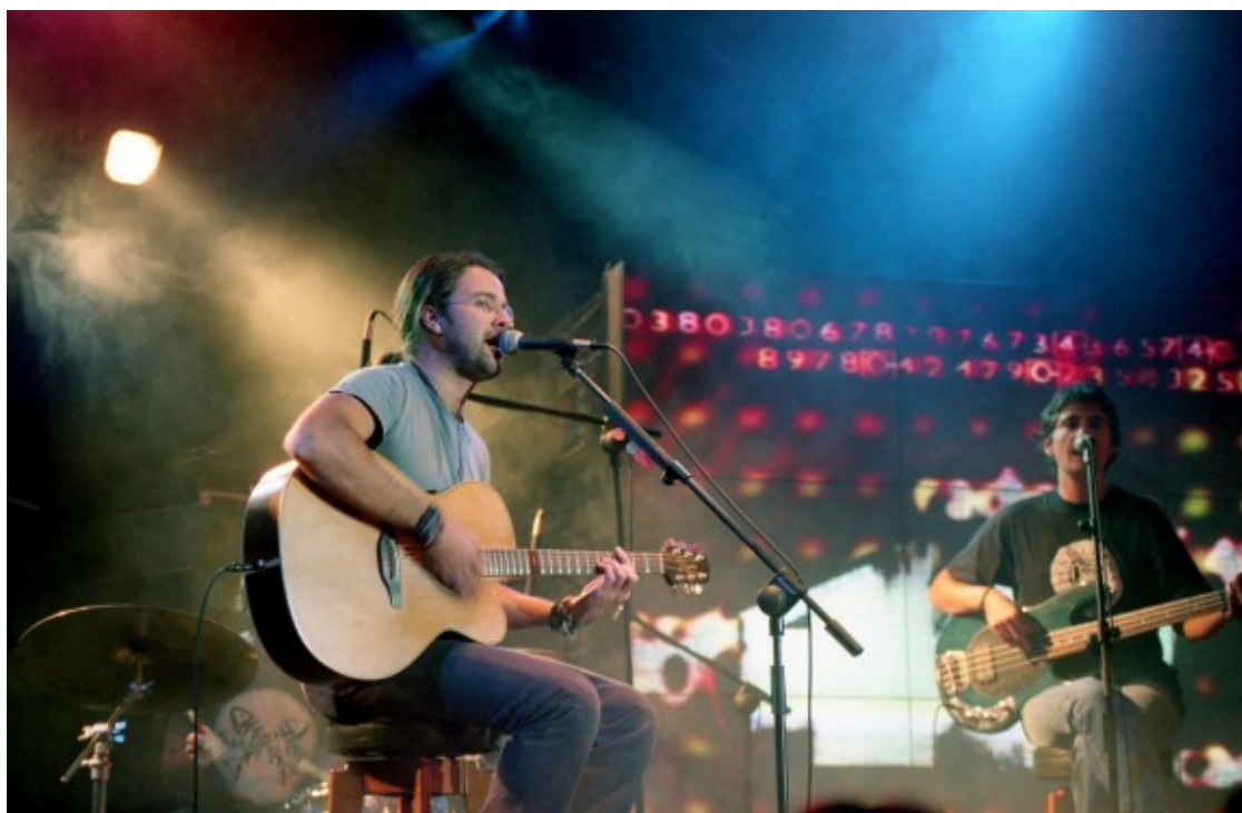
Jarabe de Palo en directe a la Sala Bikini, 1998

El passat disc va estar vuit mesos sense que ningú li fes cas. Es comentava que fins i tot la discogràfica estava a punt de donar-te la carta de llibertat. Ara tot són festes de promoció i campanyes de televisió en ple agost. No se t'ha creat una mena de ressentiment contra Virgin per veure com ara recolza un producte amb el que abans no hi creia?