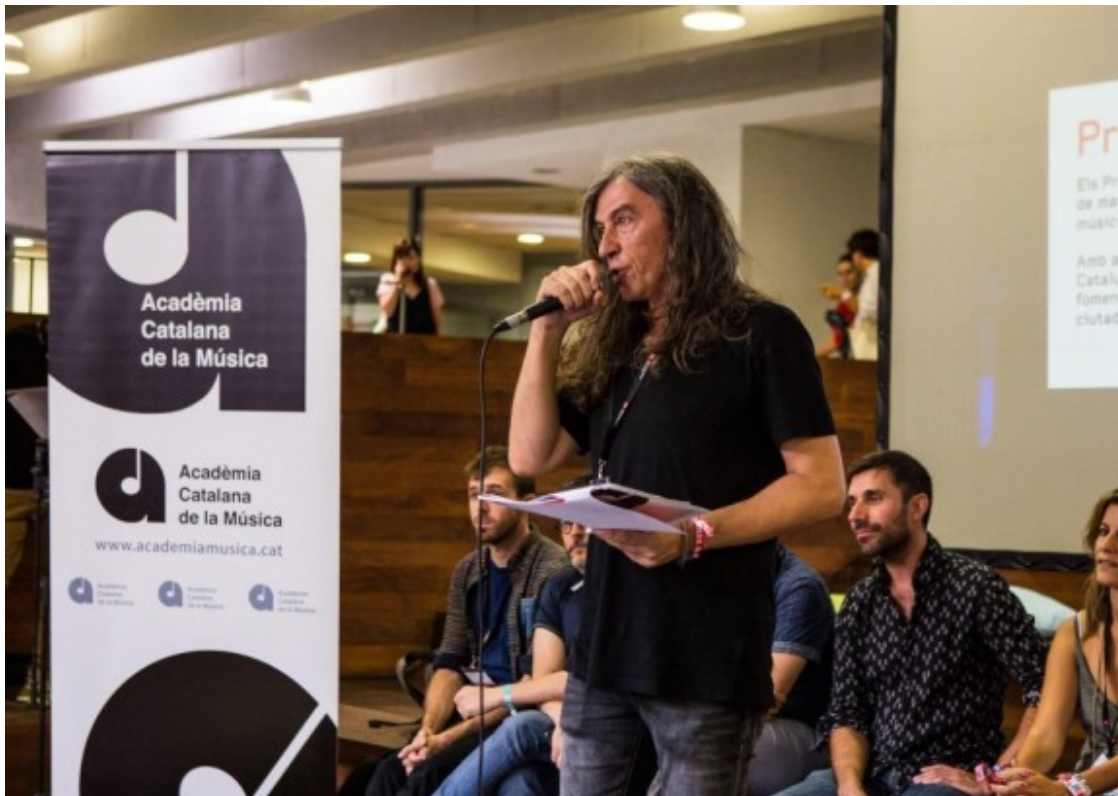
Gerard Quintana

Les mesures d'aplicació urgent són les del pla de xoc, mentre que les del pla de recuperació serien més estructurals. La distinció no està de més, com ha explicat en roda de premsa Gerard Quintana , president de l'Acadèmia Catalana de la Música: "Hi ha una mancança estructural, endèmica, al sector de la música que portem arrossegant de molt temps enrere, des de l'àmbit laboral a tot el sector i que és difícil de fer. D'aquí aquesta exposició de la situació límit en què es troba el sector i les xifres devastadores." Quintana ha incidit en el fet que cal "un marc normatiu perquè aquesta declaració de bé essencial no sigui només un gest de la conselleria de Cultura". També ha ironitzat en què si un s'ha de guiar per quins músics han pogut acollir-se a les condicions dels ajuts (un 15% de músics ha accedit a l'atur extraordinari per artistes i un 18% a la prestació de cessament d'activitat d'autònoms) en aquest país es pot dir que no tenim músics. També ha insistit en la necessitat de la interlocució de les administracions amb el sector per tal d'entendre la seva complexa realitat.