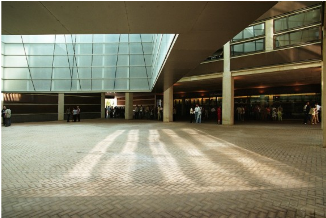
L'Auditori de Barcelona