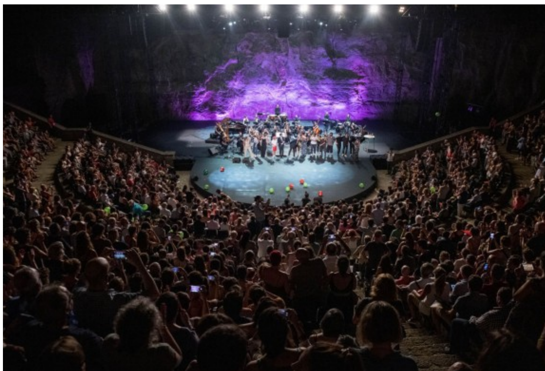
Teatre Grec