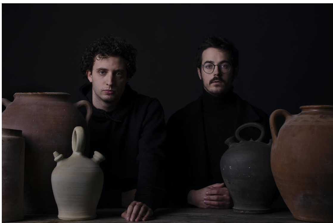
Cala Vento | Helena

Parlem amb el duet de l'Empordà sobre la seva doble estrena amb els senzills «Teletecho» y «El Acecho»