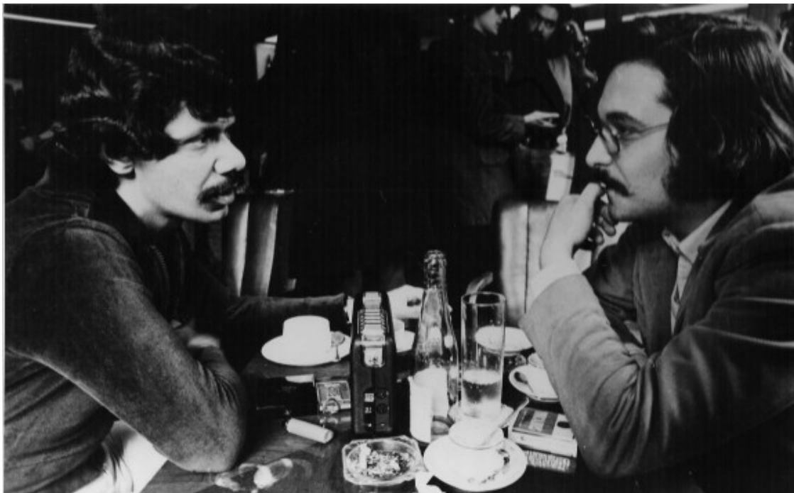
Chick Corea i Jordi Sabatés

Mentre Corea assolía el seu primer cim al Kilimanjaro com a xerpa de Miles Davis , Sabatés contribuïa a guarnir de sonoritats lisèrgiques la primera part del visionari doble àlbum Concèntric (1970) de Pau Riba . Poc després, un va invocar els esperits de la fusió amb l'evangeli segons Return to Forever (ECM, 1972), i l'altre va desafiar l' establishment de l'auca del Senyor Esteve amb la conxorxa transcultural de blues, folk i psicodèlia amb Jarka .