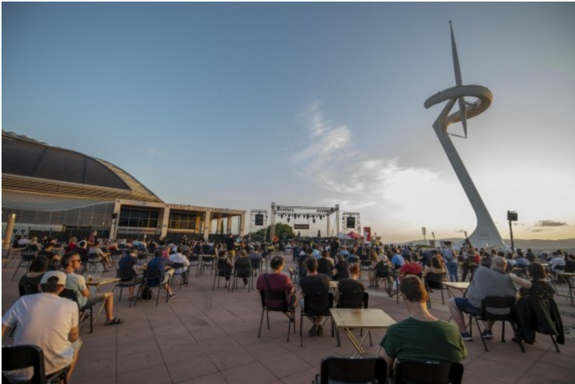
Palau Sant Jordi