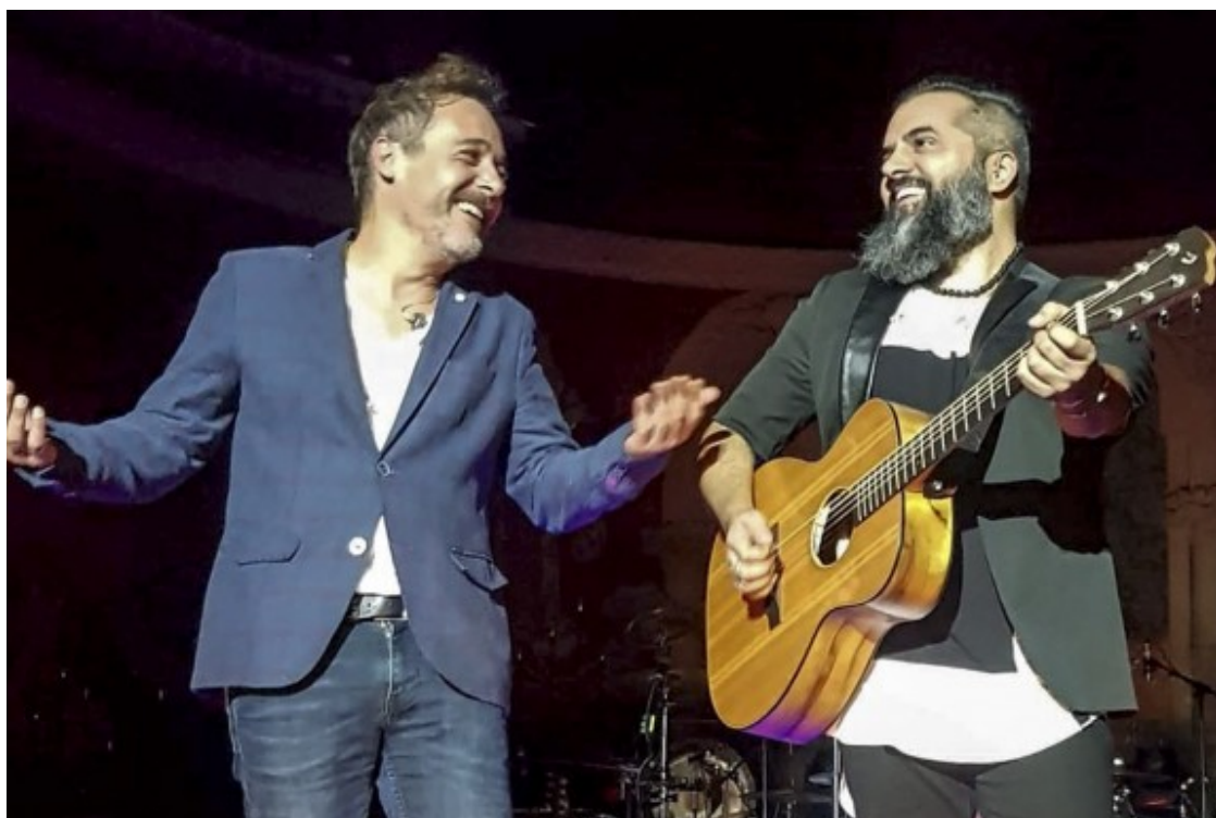
Love of Lesbian al Palau de la Música