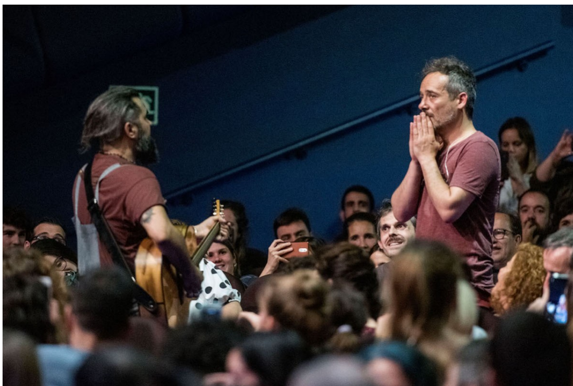
Love of Lesbian en directe | Xavier Mercadé

El 27 de març es farà un concert amb 5.000 persones dempeus sense distància social al Palau Sant Jordi | Aquesta primera actuació per a un gran públic correrà a càrrec de Love of Lesbian | L'acte es podrà dur a terme gràcies a la unió de diferents agents del sector, l'autorització del departament de Cultura i l'assaig previ que es va fer al desembre a la sala Apolo