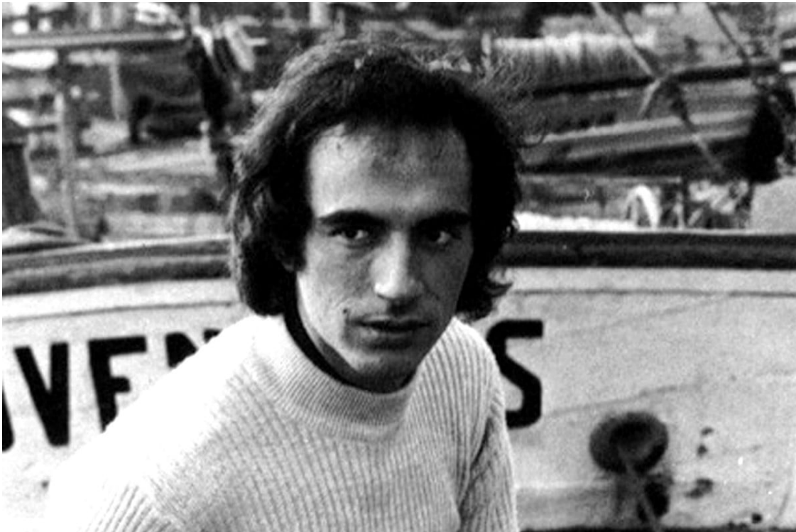
Lluís Llach

La cançó està inspirada en Joan Serra, que va tenir atemorida la zona de Valls a principis del segle XIX i va ser penjat a la forca el 4 de maig de 1815