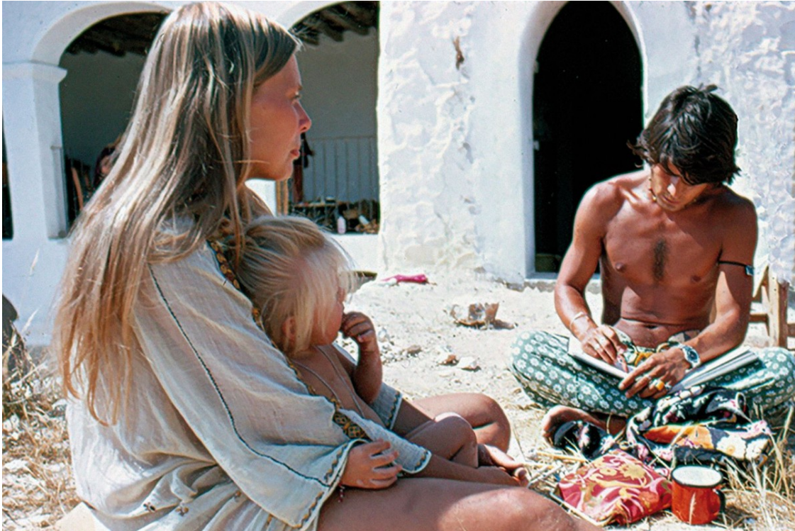
Joni Mitchell fotografiada a Eivissa durant la 'festa' de la seva cançó «Califòrnia»