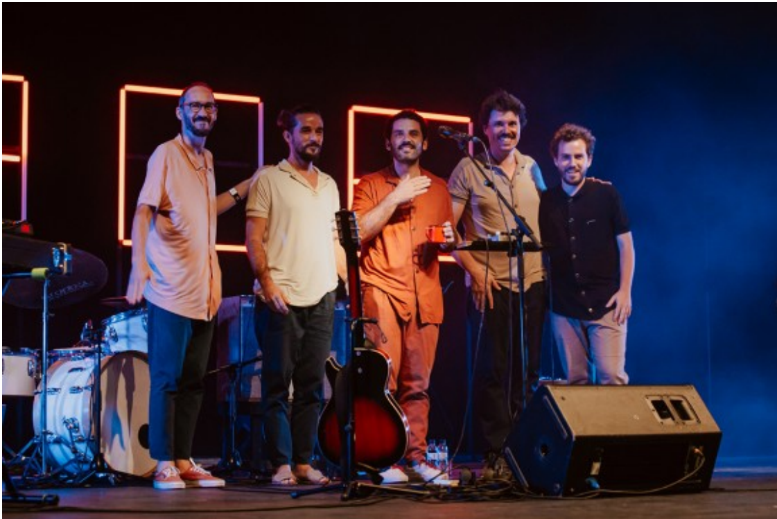
El Petit de Cal Eri! al MMVV 2021 (15/09)

Al llarg del dia d'ahir, també es van poder escoltar -fos exclusivament per a professionals o en format presencial obert al públic- propostes que van anar des de Lauren Nine a The Excitements . Els darrers van anar encapçalats per l'esplèndida veu de la cantant francosomali recentment incorporada Kiss San (que haurà, però, de batallar per fer-se tant o més memorable, després del pas per la banda del terratrèmol escènic de Koko-Jean Davis ).