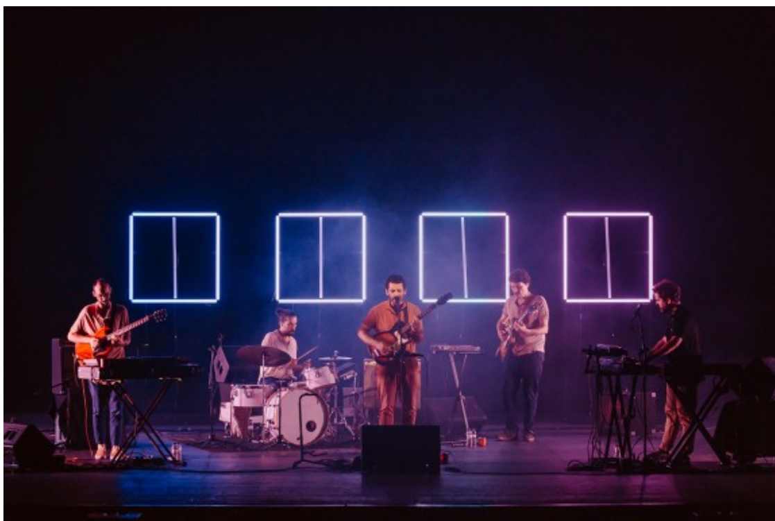
El Petit de Cal Eril al MMVV 2021 (15/09)

Tota la primera tanda de cançons van ser del nou disc fins que va arribar "Pols", de l'anterior disc Energia fosca (Bankrobber, 2019), en el mateix arrencament d'estrelles i freqüències que les de N.S.C.A.L.H. . "Pols" va donar, aleshores, pas al "Sento" -també d' Energia fosca -, ja amb la banda més relaxada d'haver fet néixer en directe bona part de l'últim àlbum i permetent-se ballar molt més.