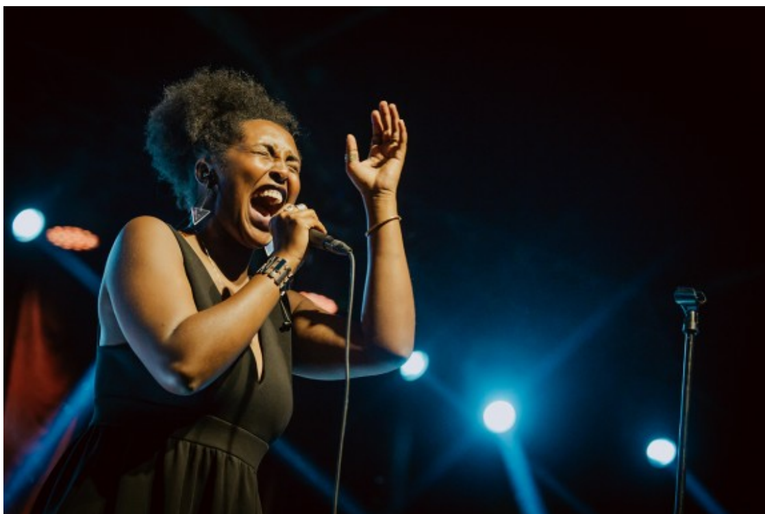
The Excitements al MMVV 2021 (15/09)