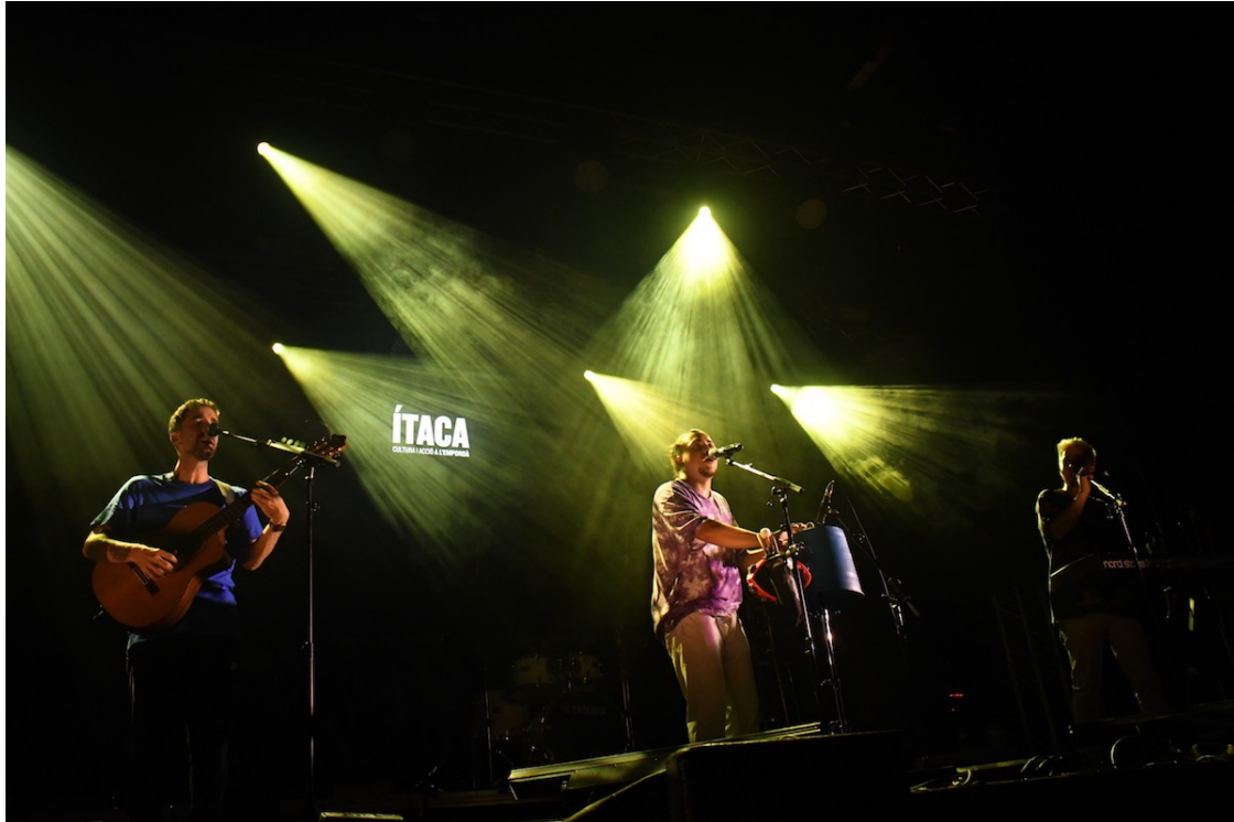
Stay Homas a l'Escala (Festival Ítaca) | Robert Carmona

El festival empordanès ha tancat aquest cap de setmana la novena edició | Des de l'abril, i malgrat la pandèmia, el cicle ha acollit més de deu mil espectadors entre els 25 concerts programats