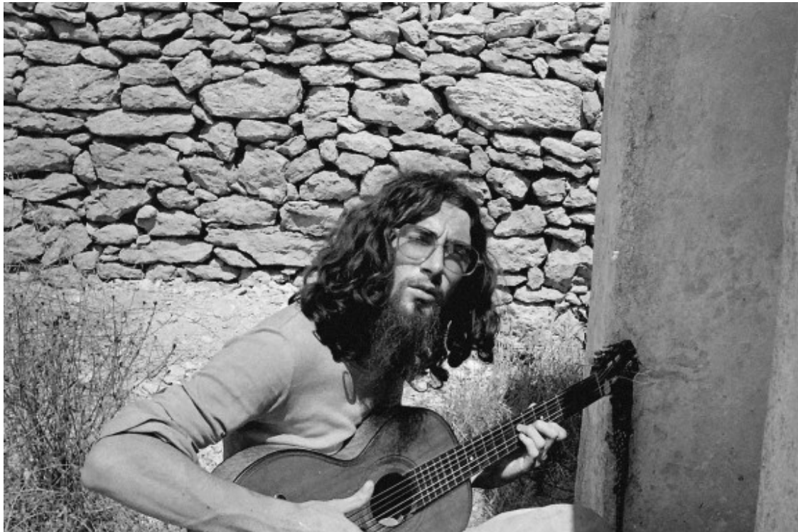
Pau Riba

Era una reivindicació contra els parts hospitalaris, amb epidurals, calmants, episiotomies? Estava en contra d'aquest muntatge que, en definitiva, és bastant sanguinari i similar a una granja de pollastres. A més, els parts poden durar moltes hores, però els metges i les infermeres tenen pressa i han de fer relleus dels torns? I llavors què fan? Deixen les dones amb les cames obertes i marxen? Moltes vegades, la solució és fer una cesària i endavant. Pim pam! Hi va haver una època en què hi havia un excés de cesàries i era sobretot per aquest motiu. Es va començar a menjar el tarro a les dones que així era més ràpid i senzill, i que d'aquesta manera patien menys. Jo he estat sempre absolutament en contra de tota aquesta entabanada de la indústria farmacohospitalària, que imposa una manera de fer prenent com a base únicament la seva comoditat.