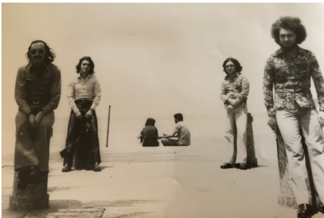
Fusioon