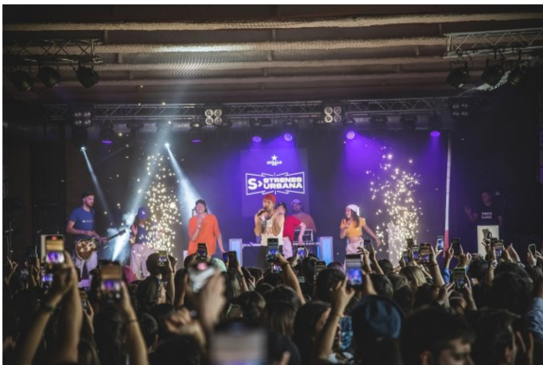
Figa Flawas a l'Strenes Urbana