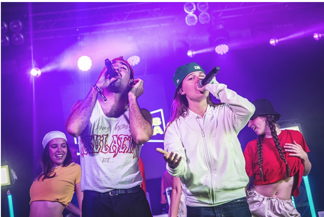
Figa Flawas i Mushka al Strenes Urbana | Gaspar Morer

El nou festival va celebrar ahir a l'Antiga Fàbrica Estrella Damm la primera edició | Hi van actuar altres artistes com Flashy Ice Cream, Scorpio, Lal'Ba, Lildami o Sofia Gabanna