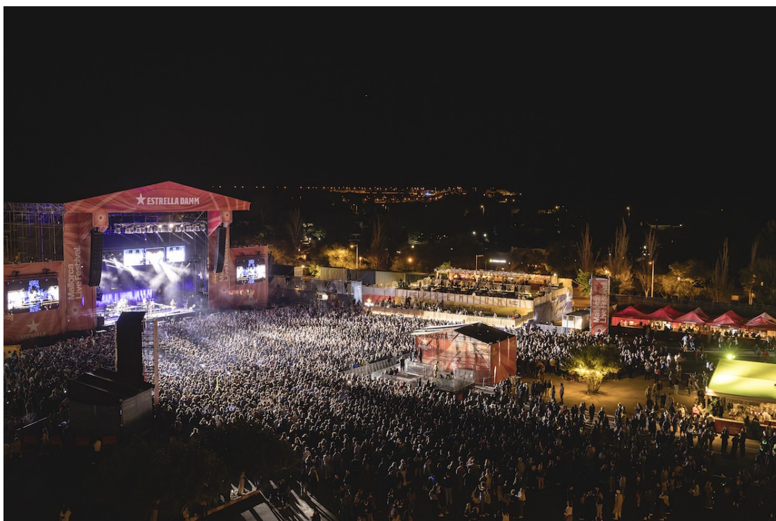
Vetusta Morla al Mallorca Live Fest

Ahir va tancar l'edició d'enguany del Mallorca Live Fest | Entre altres, aquest cap de setmana, han passat per Calvià The Kooks, Bad Gyal, Black Eyed Peas o Quevedo