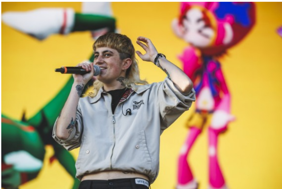
Jimena Amarillo al Mallorca Live Fest

Tornant a l'escenari principal, era el torn de dos dels atractius principals d'aquesta edició. A prop de les deu i mitja del vespre, es podia veure com la gran majoria de persones dins el recinte començaven la seva processó cap a l'escenari Estrella Damm. Amb el tema "Let's Get It Started", els Black Eyed Peas començaren un repàs per les cançons més icòniques de la formació, acompanyant bases pregravades amb una guitarra elèctrica i una bateria. Encara que es va notar l'absència de la imponent Fergie dins la formació, i es va trobar a faltar un muntatge més propi d'una banda de la seva envergadura, el públic va gaudir amb forta emoció un setlist ple de temes mítics com "Pump It" o "I Gotta Feeling".