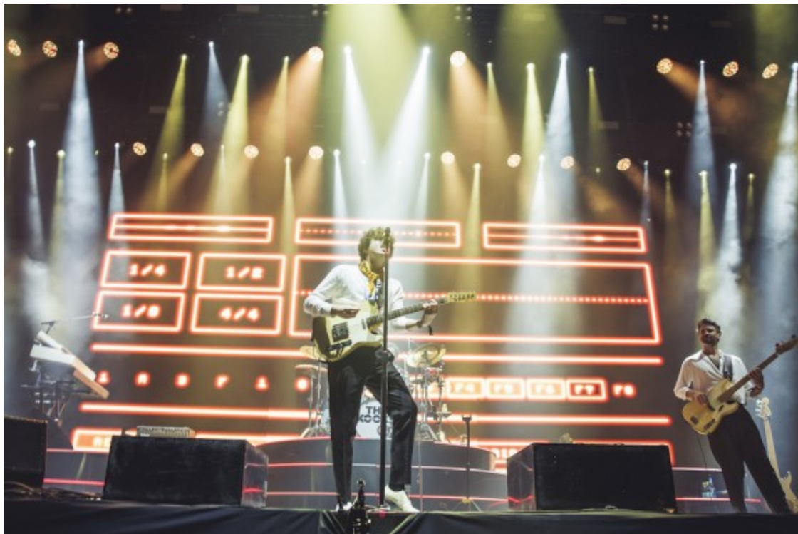
The Kooks al Mallorca Live Fest

aquesta dinàmica, trobàvem la gaditana Judeline qui, amb una sòlida i completa banda de músics, va impressionar a tot el qui no estava familiaritzat amb la seva música, entrelaçant ritmes de ball amb melodies atmosfèriques. Mentre el mallorquí Xavibo escalfava l'ambient de l'Innside amb les seves autodenominades "barras tristes", el barceloní Rojuu feia les delícies d'un més que entregat públic que no es va estar de cantar i ballar amb passió unes accelerades cançons, on dominaven lletres amb la característica malenconia de la cultura emo. La presència electrònica estava ara en mans d'un dels artistes més esperats: Rusowsky . El madrileny d'arrels bielorrusses va fer un recital que barrejava temes de caire assossegat a teclat amb cançons de bases desenfrenades que disparava des del seu ordinador, enfrontant moments d'introspecció i ball.