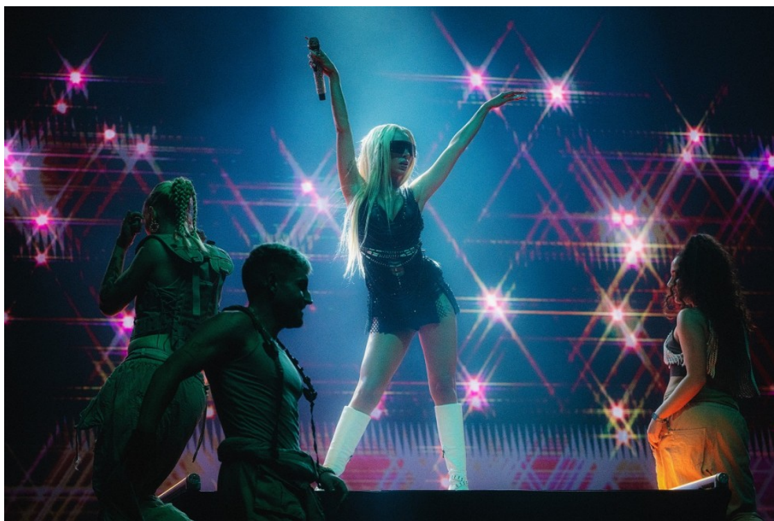
Bad Gyal al Sónar 2023

La recta final va ser una pujada accelerada de hit rere hit amb què va encendre el Sónar. "El sol me da", la banda sonora de l'anunci d'Estrella Damm d'aquest estiu, "Que rico" (col·laboració amb Un Titico ), "La prendo", "Sexy" i la traca final, amb les seves cançons més celebrades d'ara i de sempre: "Nueva York (Tot*)" (2021), "Alocao" (2019) i "Fiebre" (2016). Un show amb un ritme trepidant que no va donar treva als balls acalorats amb què la rebia el públic -ni tampoc als ballarins, entre els quals una duia un ventall en tot moment-. L'única cosa més que es podria haver demanat del directe de Bad Gyal és l'esperada col·laboració amb una de les noves promeses de la música urbana catalana, la seva germana Mushka .