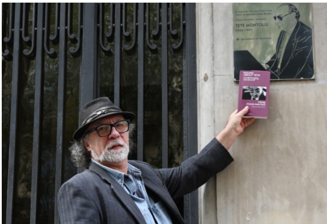
Pere Pons

El títol Round About Tete és una aclucada d'ull a un dels músics que més admirava Tete Montoliu : el pianista i compositor Thelonious Monk -compartien a més les mateixes inicials, T. M.-- a través d'una de les seves peces més clàssiques, "Round About Midnight". A més, encaixa a la perfecció amb l'esperit del llibre pel fet que suposa una biografia coral a l'entorn a de la seva figura i de la seva obra. D'aquesta manera, la proposta articula un viatge a l'entorn del Tete segons la visió que han tingut d'ell molts dels que els van conèixer i tractar. I a la llista a apareixen molts personatges de l'escena musical de diferents generacions, procedències i naturalesa (instrumentistes, programadors, crítics, promotors, mànagers), però també altres noms de l'àmbit de la creació artística (cineastes, escriptors, poetes) i veus del seu cercle més íntim (familiars, amistats, amants).