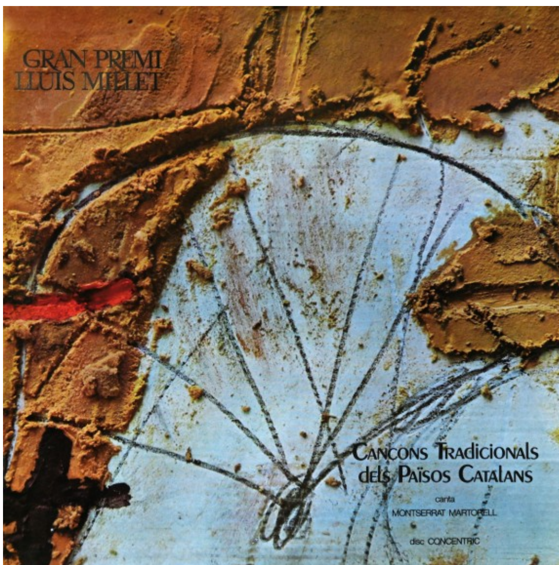
'Cançons tradicionals dels Països Catalans' (Concèntric, 1966) | LP

El mateix escriptor explica la relació amb l'autor de la portada, en un escrit a la part de darrere del disc: "Pensant en les nostres terres, vàrem decidir de lligar l'art plàstic amb la música. Un dels catalans més universals que mai hem tingut, el pintor Antoni Tàpies, treballa amb terres. El que vàrem demanar-li era lògic: una pintura que fos la creació d'una mena de mapa nou. I l'obra extraordinària que Tàpies ha accedit de fer expressament per a presentar aquest disc és, a part de la seva vàlua artística, una lliçó plàstica de visible transcendència i significació. També seria, doncs, natural i just que en parlar d'aquest disc molts l'anomenessin 'Les cançons tradicionals d'en Tàpies'". I el resultat van ser les Cançons tradicionals dels Països Catalans .