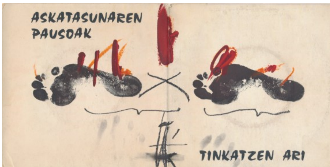
'Askatasunaren Pausoak Tinkatzen Ari' (Egilea Editore, 1972) | SG-7" | Editat a França

l és que Imanol era un artista prohibit i proscrit pel règim. Tots dos es van conèixer exiliats a la capital francesa i Ibáñez , més experimentat, va ajudar-lo a l'inici. La pintura que il·lustra tota la carpeta, per davant i per darrere, va ser una creació de Tàpies per als exiliats. S'hi plasma un peu que avança cap a la llibertat, en al·lusió a la caiguda de la dictadura.