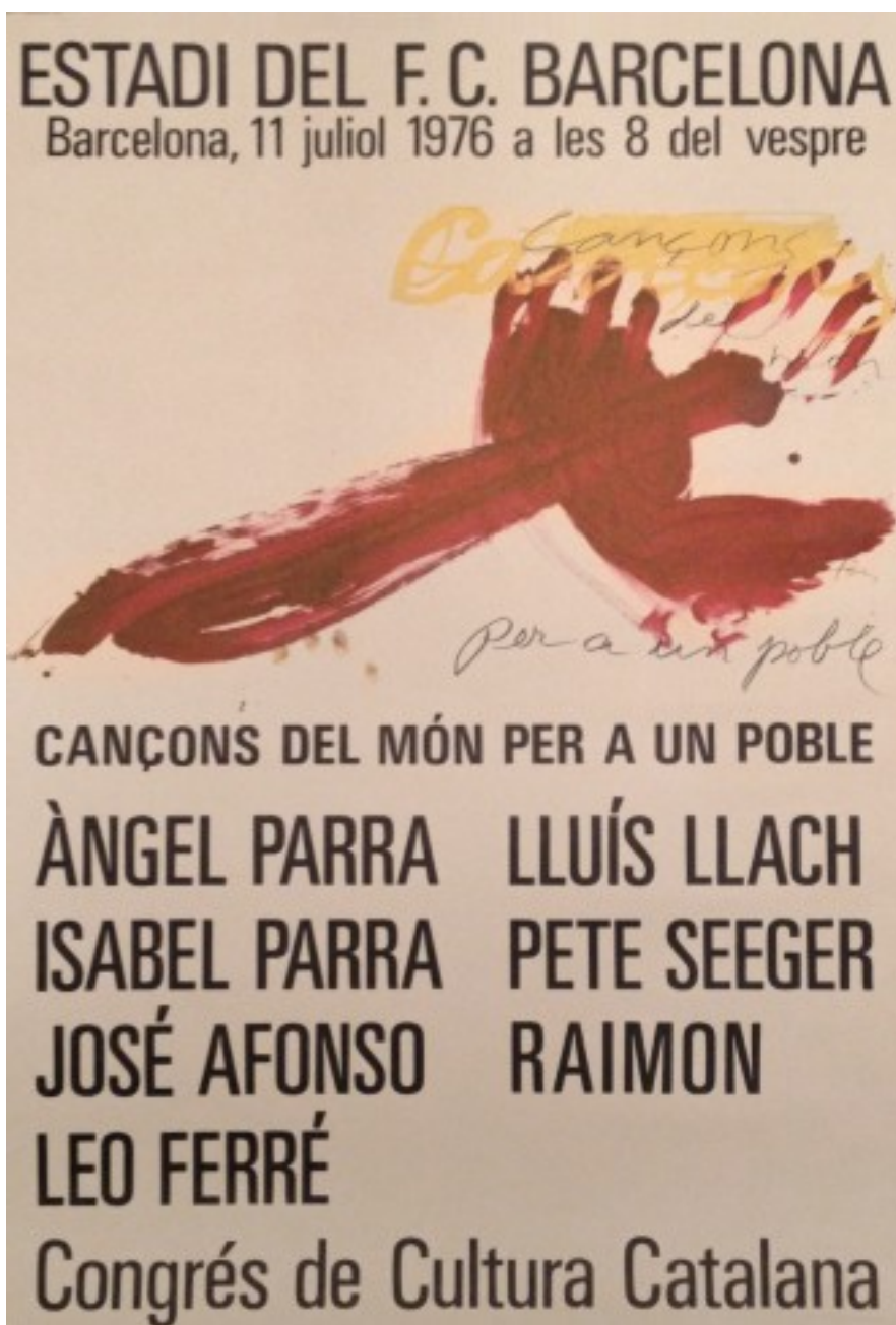
Cartell del concert prohibit pel Govern Civil l'any 1976