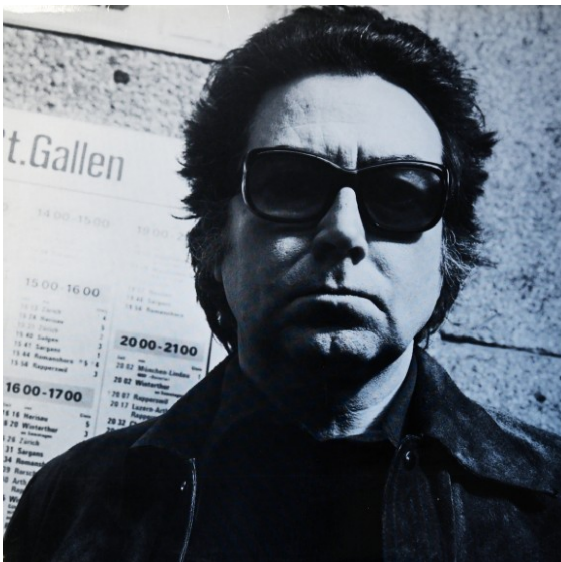
'Comunicació sobre el mur / Communication sur le mur' (Erker-Verlag, 1976) | LP editat a Suïssa

La companyia discogràfica suïssa Erker-Verlag va voler anar més enllà i va publicar un disc de llarga durada amb l'enregistrament de la veu del pintor català. La cara A de l'àlbum conté la veu de Tàpies llegint el text en català durant 16 minuts, i la cara B replica el mateix contingut, però en francès. En un i altre cas es refereix a la seva obra sobre 'parets, finestres i murs', i diu: "Mai no han estat un fi en elles mateixes, sinó que han de ser vistes com un trampolí, com un mitjà per atènyer unes metes més llunyanes".