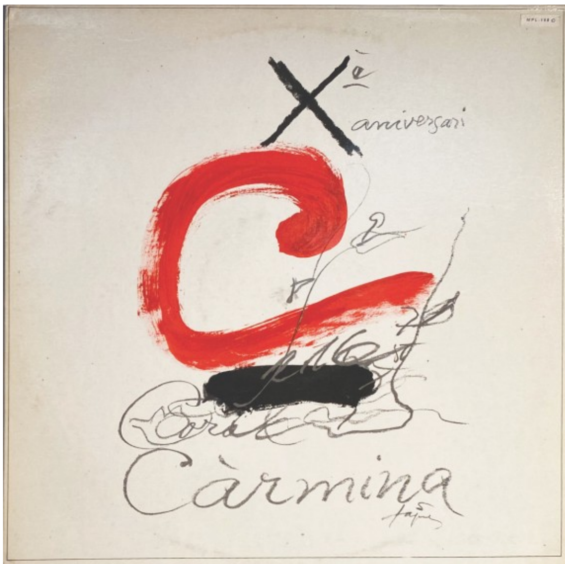
Xè aniversari (Puzzle, 1982) | LP

L'obra va esdevenir la portada de l'opuscle publicat aquell mateix any, on apareix aquest text: "La Coral Càrmina agraeix d'una manera especial al pintor Antoni Tàpies la gentilesa que ha tingut en oferir-nos l'original que es reproduïx a la portada d'aquest opuscle". La il·lustració va ser utilitzada també per a la portada de l'àlbum del seu desè aniversari, que recull una quinzena de cançons interpretades per la coral sota la direcció del mestre fundador Casas i amb l'acompanyament del piano d' Àngel Soler .