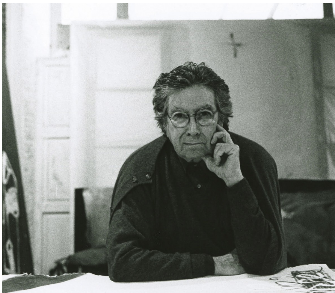
Antoni Tàpies | Raphael Gaillarde

Repassem el vincle de l'obra de Tàpies amb una quinzena de discos, en el centenari del naixement de l'artista