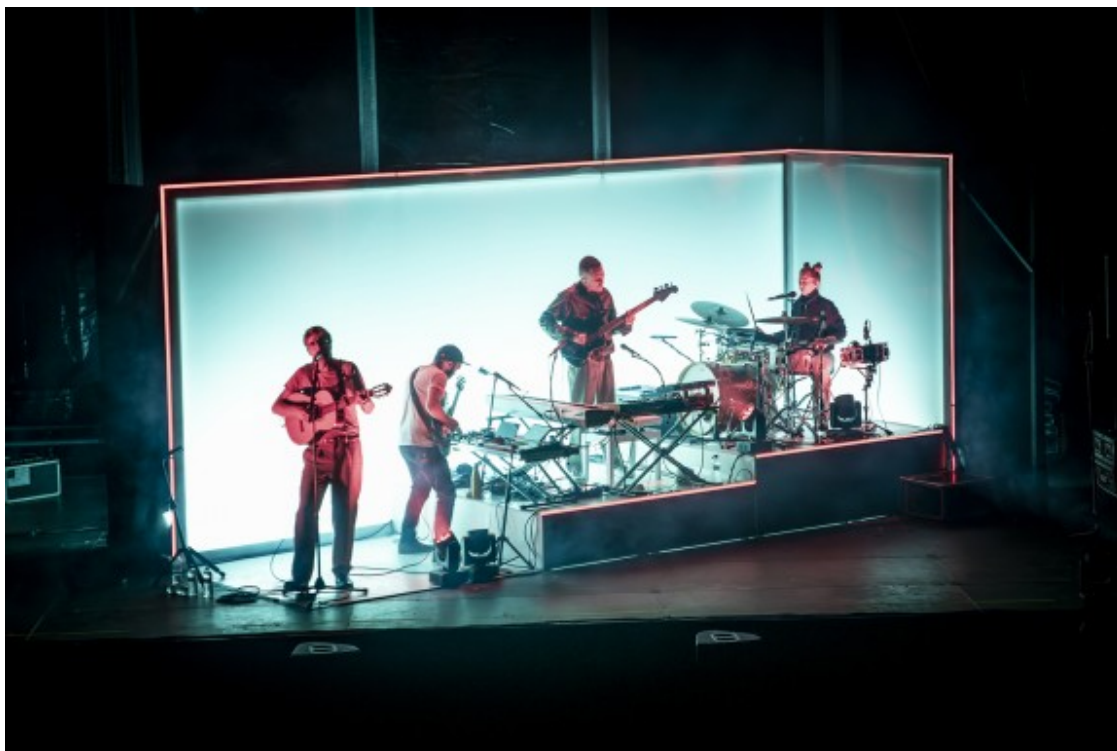
Quatre músics i un ciclorama.