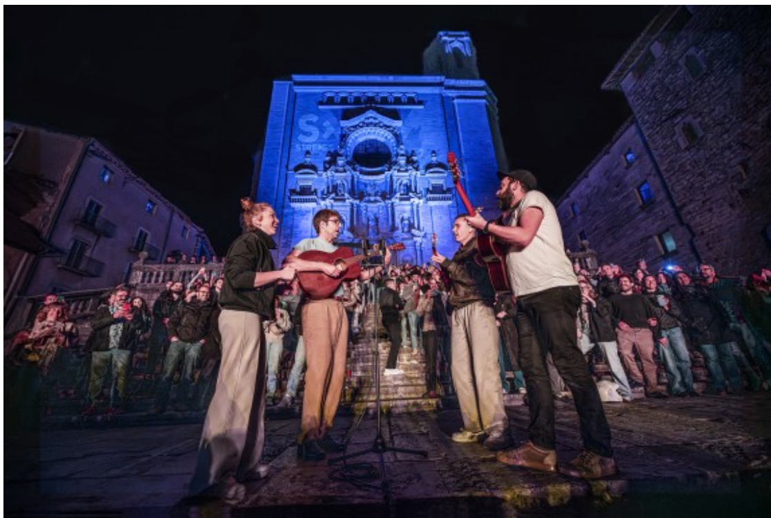
Bis final amb "Estudiantina".