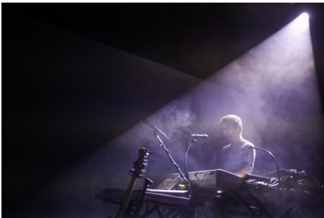
Al piano, a l'Apolo.