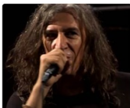
L'Empordà, de Sopa de Cabra