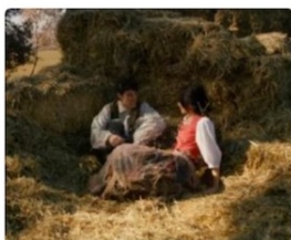
Coti x coti, de The Tyets