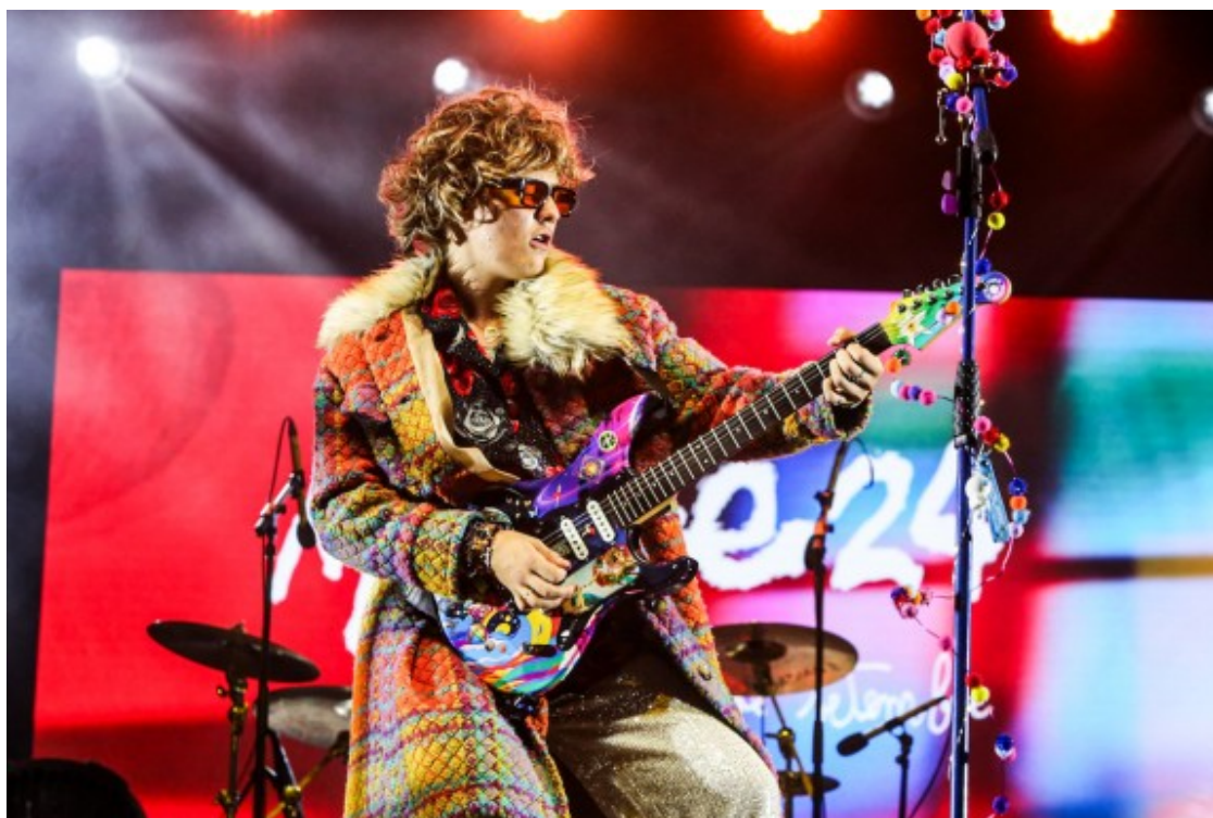
Makuka a la darrera semifinal del Sona9 2024 a Plaça Catalunya (Barcelona)

Demà 24 de setembre es podran recuperar totes les actuacions de la fase semifinal del Sona9 2024 a Enderrock.cat i Sona9.cat i votar els preferits de l'edició perquè guanyin el Premi Verkami de Votació Popular i passin així directament a la final. Les altres tres propostes de la final les escollirà el jurat del concurs.